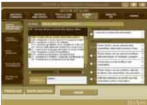
Schermata con le voci selezionate per l'elaborazione del PDP: esempio di enunciati graduati nella sezione della didattica individualizzata e personalizzata.

Il team degli insegnanti di Marco decide, poi, di personalizzare il PDP inserendo solo alcune delle possibili strategie suggerite per la didattica individualizzata e personalizzata, gli strumenti compensativi, le misure dispensative, la valutazione e gli impegni della famiglia. Gli insegnanti selezionano, infatti, quelle che ritengono realmente fattibili e ne stabiliscono una certa gradualità. Valutano, cioè, se ciascuna di esse può essere applicata sempre o solo in alcune circostanze, in tutte le sue potenzialità o solo in parte. Nel caso specifico, concentrano l'attenzione sull'avvio all'utilizzo delle nuove tecnologie per la scrittura e lo studio, nonché sull'uso di modalità didattiche e di studio che tengano conto dello stile visivo dell'alunno e ne salvaguardino l'aspetto emotivo. Se da un lato, perciò, stabiliscono che l'alunno venga avviato all'uso del computer tralasciando, almeno per ora, l'opportunità di insegnargli a usare il registratore durante le lezioni in classe, dall'altro, considerato il suo basso livello di competenza tecnologica, scelgono di proporgli un addestramento con programmi di videoscrittura, correttore ortografico e sintesi vocale, solo nelle operazioni di base.