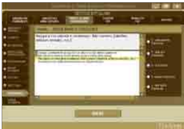
Schermata con le voci per la definizione del profilo dell'alunno: sezione inerente la matematica.

Nel profilo che i docenti delineano, oltre a inserire i dati relativi a dislessia e disortografia, vengono introdotte le voci sul livello cognitivo nella norma, su una certa difficoltà nella memoria di lavoro e sulla dispensa dalle prove scritte di lingua straniera, così come indicato nella diagnosi stessa.