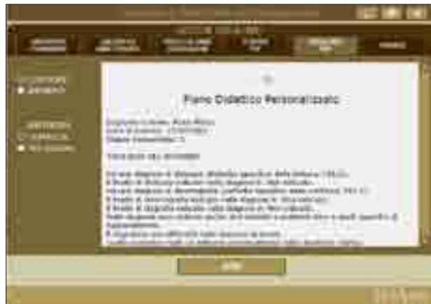
Schermata di visualizzazione del PDP da cui è possibile aprirlo con un editor di testo.

Può accadere, infatti, di rendersi conto solo alla fine di aver inserito un numero di voci eccessivo, con il rischio di riuscire a concretizzarne solo alcune, o di essersi imbattuti in una qualche contraddizione. Inoltre può essere necessario snellire il linguaggio e la forma per rendere maggiormente comprensibile e immediato il contenuto.