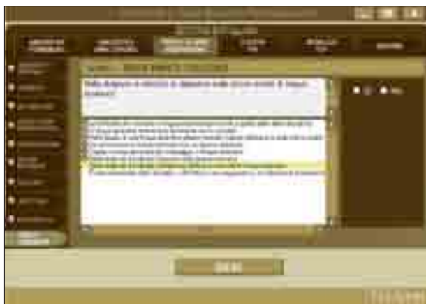
Schermata con le voci per la definizione del profilo dell'alunno: sezione inerente la lingua straniera.

Nel profilo che i docenti delineano, oltre a inserire i dati relativi a dislessia e disortografia, vengono introdotte le voci sul livello cognitivo nella norma, su una certa difficoltà nella memoria di lavoro e sulla dispensa dalle prove scritte di lingua straniera, così come indicato nella diagnosi stessa.