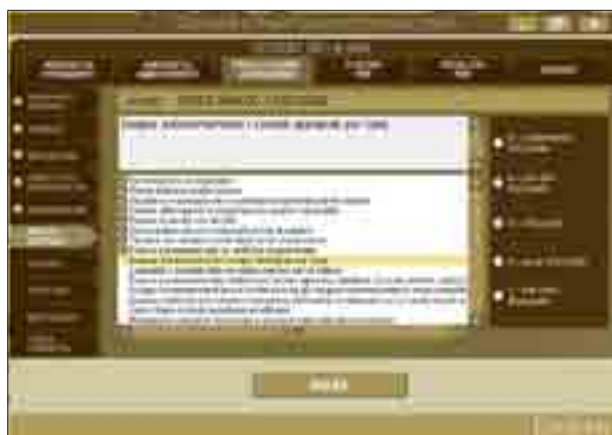
Schermata con le voci per la definizione del profilo dell'alunno: sezione inerente le abilità di studio.