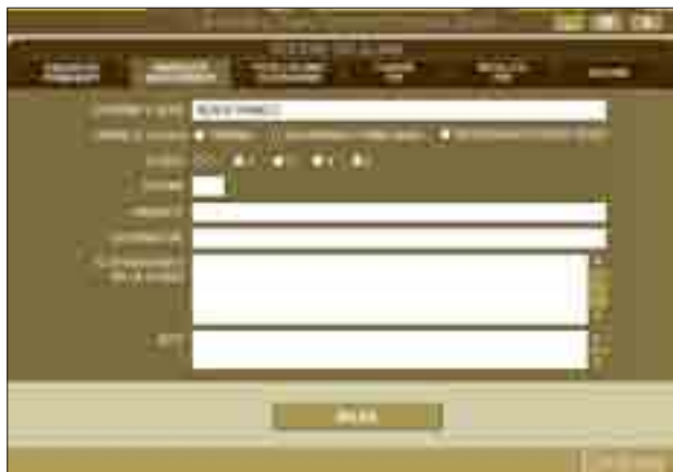
Schermata relativa all'anagrafica dell'alunno.

Gli insegnanti di un ipotetico alunno con DSA, Marco Rossi, dopo aver inserito alcuni essenziali dati anagrafici inizieranno a rispondere alle domande del questionario per definire il profilo dell'alunno e consentire quindi al programma di individuare le voci più pertinenti da proporre per il suo PDP.