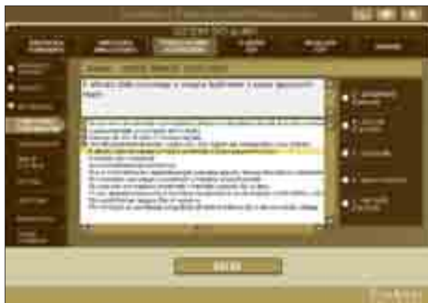
Schermata con le voci per la definizione del profilo dell'alunno: sezione inerente le competenze compensative.